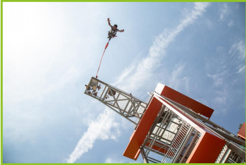
BUNGEE JUMPING DA 20 m