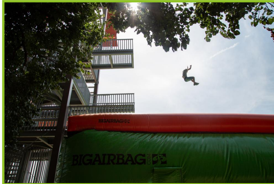
BIG AIR BAG